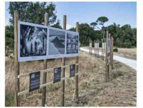
L'exposition, ouverte à tous les publics jusqu'au 2 octobre, présente des photos en noir et blanc des quatre coins du monde. C. M.

Depuis le 12 juillet et jusqu'au 2 octobre, l'association Pleine ouverture organise une magnifique balade photographique sur le chemin des Lapins, à Arès. Quatre photographes de renommée internationale, choisis par le collectif de l'association, présentent leurs œuvres pour la 4 e édition de cette exposition. Pour Denis Lagarde, « la particularité, cette année, est la place du noir et blanc », qui représente selon lui « la quintessence de la photo ».