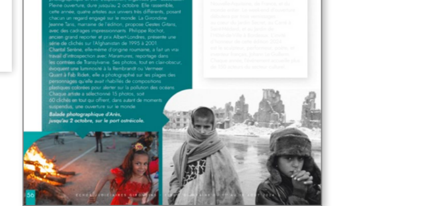
Balade photographique d'Arès, jusqu'au 2 octobre, sur le port ostréicole.

ROULOTTES ET PRIX INTERNATIONAL La série proposée par Jeanne Tarnis vient de "Gestes gitans", un engagement esthétique assumé, des situations remplies d'émotion, des hommes et femmes atypiques qui « disent la vie », principalement autour de la communauté de Perpignan et des pèlerinages des Saintes-Maries-de-la-Mer. Ses photos, primées, sont publiées dans des magazines à l'international.