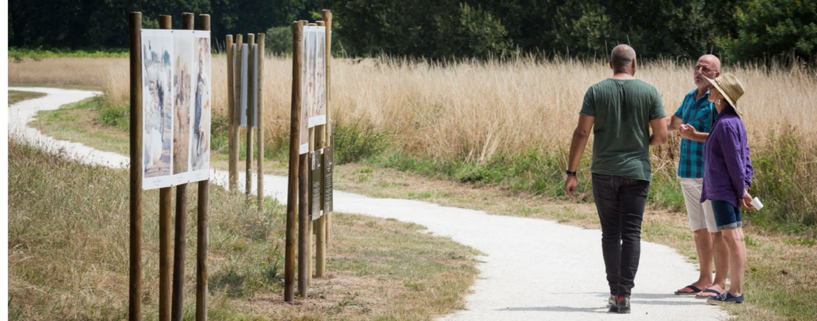
vernissage de l'exposition en plein air «D'un Monde à l'Autre» organisée par Pleine Ouverture en 2023.