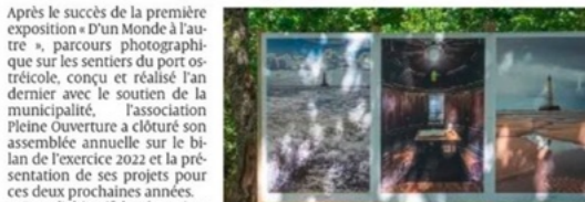
Pleine ouverture a proposé le parcours « D'un monde à l'autre », l'an dernier. P. LABOILE

Une biennale pour 2024 est clairement en cours de montage et les partenariats nécessaires à la création d'une Biennale de l'Image, comprenant ateliers d'initiation, expositions et conférences, concours et création d'une photothèque dédiée au territoire. Les intéressés, d'ici et d'ailleurs, associations, soutiens et pro-