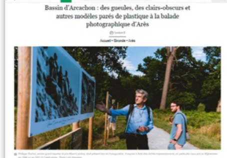
Quatre photographes multiconceptuels exposent près du port ostréicole d'Arès, sur le Bassin d'Arcachon, jusqu'au 2 octobre. Un événement qui mêle le dessin, organisé par un collectif de photographes passionnés.

C'est un samedi ensoleillé et chaud à Arès, le dernier d'août. C'est après-midi, quelques personnes profitent du moment, se promènent sur le port ostréicole de cette commune du bassin d'Arcachon. Face aux cabanes colorées où les pêcheurs du Bassin, certains choisissent d'empêcher le soleil d'être pleinement maître « des Lapins », devant signer un panneau annonçant une « balade photographique ».